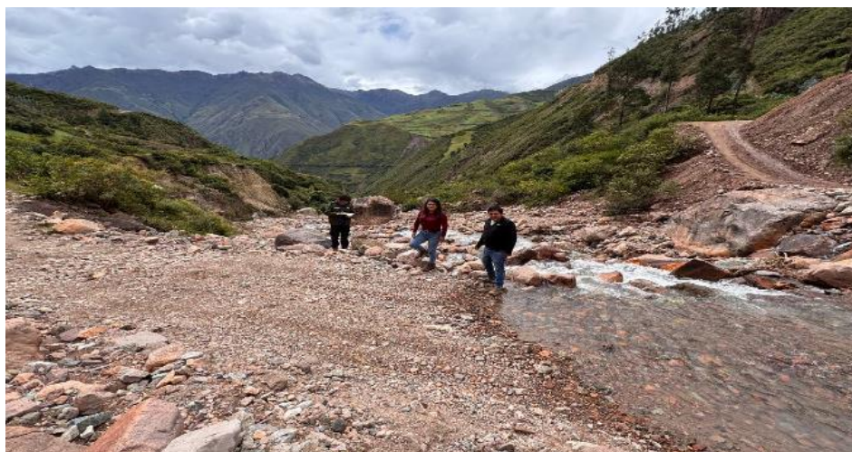
FIGURA N°03: EN EL FINAL DEL TRAMO DE LA QUEBRADA SUCNAYA HA AFECTADO CARRETERA HACIA CONDORMARCA