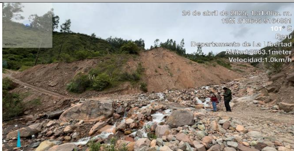
FIGURA N°01: RECORRIDO E IDENTIFICACION DE TRAMOS CRÍTICOS DESDE EL PUNTO DE INICIO, DONDE SE PUEDE VISUALIZAR QUE LA QUEBRADA SUCNAYA EN SU MARGEN DERECHA E IZQUIERDA AFECTADO A CULTIVOS Y VIVIENDAS, EROSIONANDO TERRENOS EN MAXIMAS AVENIDAS.