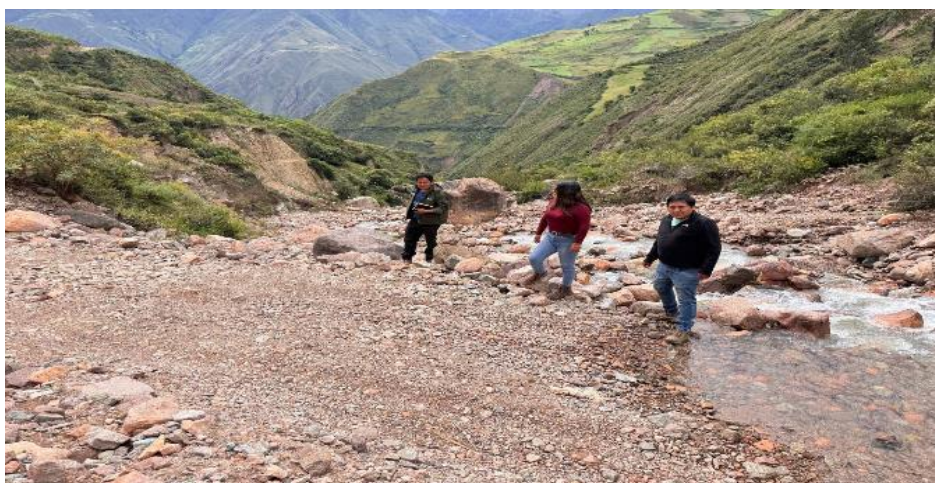
FIGURA N°02: EN EL RECORRIDO SE OBSERVA QUE LA QUEBRADA SUCNAYA, EN SU MARGEN DERECHA E IZQUIERDA VIENE AFECTADO LA CARRETERA HACIA CONDORMARCA.